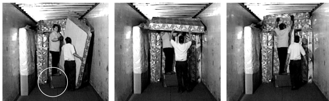
Figure III : Les solutions apportées par le CP concernant le chargement de matelas à l'intérieur d'une remorque. On remarque que le travailleur n'est plus seul pour effectuer la tâche et utilise maintenant un banc (encerclé)

Les membres du CP ont validé les tâches de manutention à risques à l'aide de leur expérience de travail et à l'aide de la grille d'analyse. Par la suite, il fallait rechercher des solutions afin de diminuer les risques d'accident. Pour chacune des tâches de manutention à risques, le CP a proposé des solutions soit d'ordre technique, soit d'ordre méthodologique. Les solutions d'ordre technique comportent une modification ou l'ajout d'un outil de travail facilitant la manutention faite par les travailleurs. Tandis que les solutions d'ordre méthodologique portaient sur les méthodes de manutention utilisées par les travailleurs. Dans l'exemple présenté à la figure I, le travailleur effectuait la tâche seul sans aucune aide technique. Le CP a proposé, premièrement, d'ajouter un banc pour réduire la flexion au niveau des épaules et l'hyperextension au niveau de la portion lombaire de la colonne vertébrale (solution d'ordre technique) et deuxièmement, que la tâche se fasse à deux travailleurs au lieu d'un seul (solution d'ordre méthodologique).