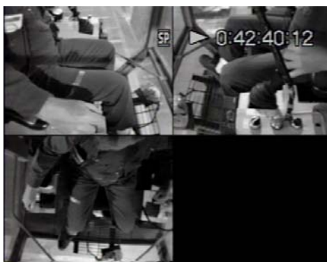
Figure 1. Exemple d'image recueillie pendant le travail des pontiers.

La cinématique de l'ensemble des mouvements réalisés par le travailleur durant l'exécution des manœuvres fut recueillie à l'aide d'enregistrements vidéo. Trois caméras furent utilisées pour observer les mouvements des membres supérieurs et les tâches réalisées. Ces caméras furent reliées à un coupleur d'images permettant d'enregistrer l'image des trois caméras simultanément. Ces enregistrements ont permis d'associer les valeurs EMG avec les multiples mouvement effectués par les pontiers (Figure 1).